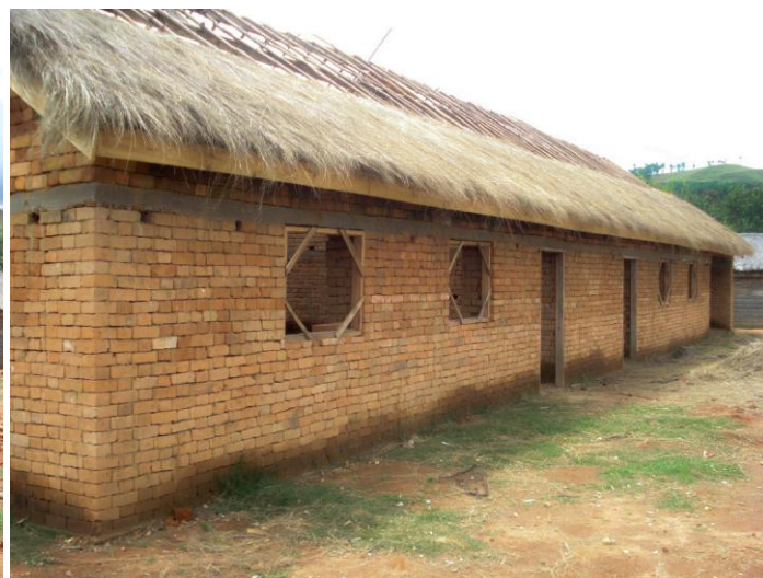
Charpente et début de toiture en avril 2013

Ce projet nous tient à cœur pour plusieurs raisons. Cette réalisation est un projet Malgache sérieux et en cours de réalisation, dont 70% du cout est financé par les initiateurs. Cet établissement en milieu rural isolé est une nécessité. Les collégiens peuvent suivre le programme de l'Education Nationale Malgache, car l'école de Vohibe est sous contrat avec le ministère. Ce sont par ailleurs des comités de gestion (parents d'élèves et des enseignants) qui gèrent l'entretien et l'organisation scolaire de l'établissement. De nombreux enseignants sont sédentarisés au village. Notre association « les enfants de Madagascar » soutient pédagogiquement ces enseignants en leur fournissant matériel et ouvrages récents de tous niveaux. Une bibliothèque est en cours de réalisation dans l'école. Nous avons décidé de nous impliquer plus encore sur ce secteur isolé en apportant animations et formations sur l'école de Vohibe. Notre budget, bien engagé sur d'autres projets, ne nous permet pas de financer actuellement ces 2.000 €. manquants. Il est évident que suivi des travaux, compte rendu des objectifs atteints et allocations diverses de matériel et ouvrages feront l'objet de compte rendus pour le partenaire qui aidera ces 144 élèves à obtenir un toit et les classes dans lesquelles ils recevront une formation très satisfaisante.