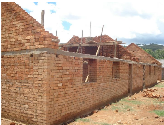
Début de la construction en février et mars 2013

Notre association participe régulièrement à des projets de ce type et peut s'engager au suivi des finitions et au compte rendu dès utilisation de ce bâtiment par les collégiens.